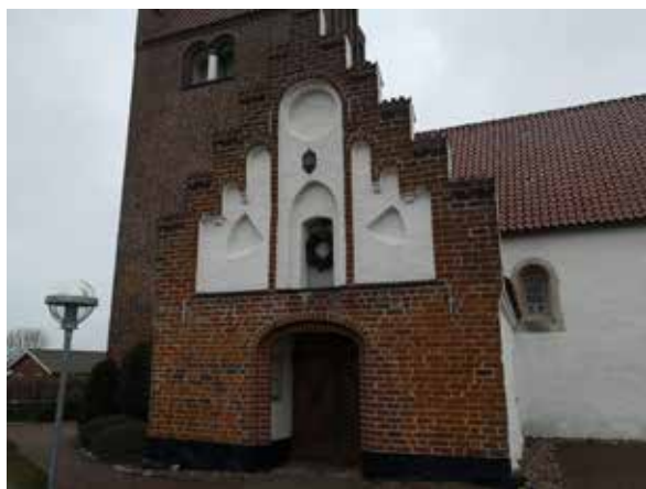
Søften kirke med en ny glasdør.

Siden 2014 har vi i Ejendomsudvalget arbejdet på at energirenovere Søften kirke, så vi ikke bruger mere energi end absolut nødvendigt - og målet er, at det stadig opleves behageligt at være til stede, når der afholdes en af de mange forskellige tjenester i kirken. Det er energimæssigt lidt af en udfordring, for Søften kirke har meter-tukke mure, som ikke kan varmes op på nogle få timer. Derfor skal vi have placeret varmeradiatorer langs væggene, så vi kan modvirke det kuldenedfald, der kommer fra de tykke mure. Det gør også, at vi bedre kan styre varmefordelingen, og kirkens varmeanlæg bliver koblet op på Sognets kalender – så når der bookes et bryllup, vil systemet selv sørge for, at varmen i kirken er på plads, når den store dag oprinder.